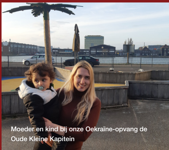
Moeder en kind bij onze Oekraïne-opvang de Oude Kleine Kapitein

Hier stellen we alles in het werk om de veiligheid van uit oorlog gevluchte mensen te waarborgen.